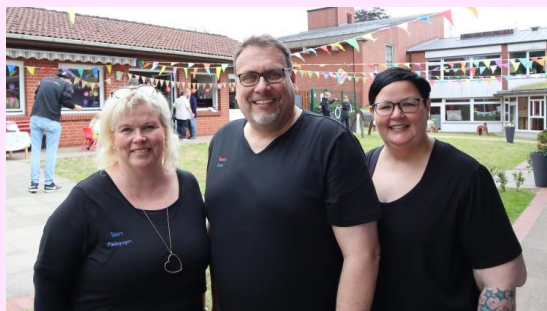
7. Juni 2024