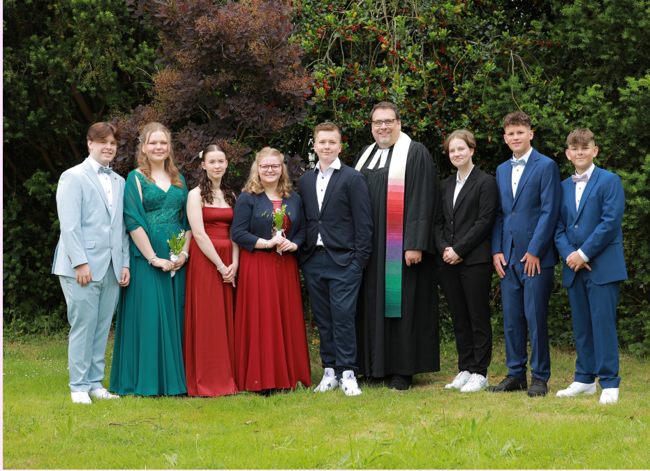
25. Mai und 1. Juni 2024