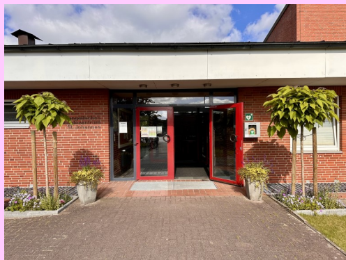
Kremperheide - Krempermoor - Wellenkamp-Süd/West

Ev. Luth. St. Johannes- Kirchengemeinde Kremperheide